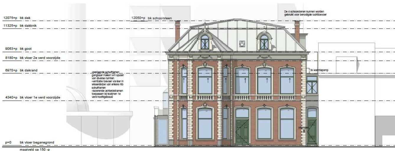
Voorgevel - nieuw